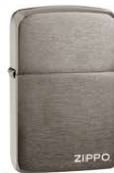
24485 1941 Replica Black Ice* Laser Engrave