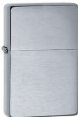
230.25 Vintage Brushed Chrome