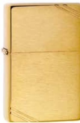
240 Vintage Brushed Brass