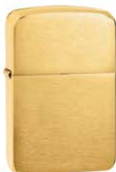
1941B 1941 Replica Brushed Brass