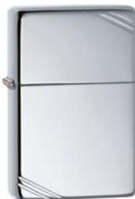
260 Vintage High Polish Chrome