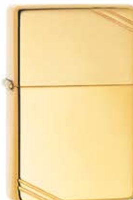
270 Vintage High Polish Brass