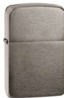
24096 1941 Replica Black Ice*