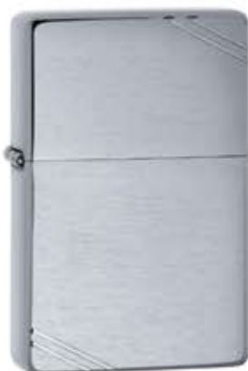
230 Vintage Brushed Chrome