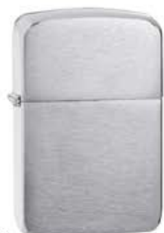
1941 1941 Replica Brushed Chrome