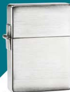
1935.25 1935 Replica Brushed Chrome