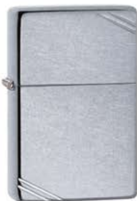
267 Vintage Street Chrome