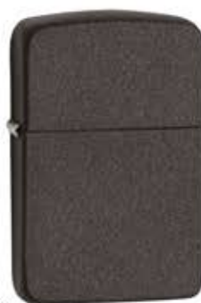
28582 1941 Replica Black Crackle*