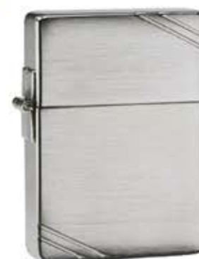
1935 1935 Replica Brushed Chrome